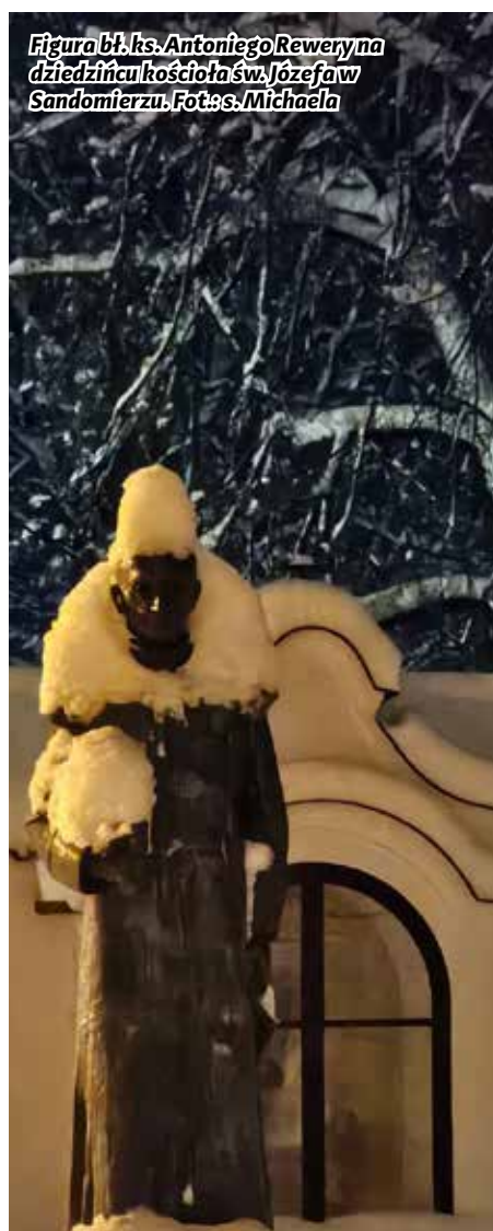
Figura bł. ks. Antoniego Rewery na dziedzińcu kościoła św. Józefa w Sandomierzu.

mować łaski Boże i jak je pomnażać służąc Bogu i bliźnim. Dzisiaj, o czym też wspomniał Kaznodzieja, Ojciec Święty Leon zamknie ostatnie drzwi Jubileuszowe, drzwi bazyliki św. Piotra, co zakończy Rok Święty, ale to nie znaczy, że łaska przestanie działać i z tą myślą mamy iść do świata i głosić Chrystusa jak rozsiani po całej ziemi misjonarze. Każdy na miarę swoich sił, a Zgromadzenie wg charyzmatu bł. Ojca Antoniego i potrzeb Kościoła tu i teraz. Niech nam Pan w tym błogosławi i o to prosił też główny Celebrans udzielając nam uroczystego błogosławieństwa na zakończenie Mszy świętej. A potem, jak to zwyczajnie bywa, było wspólne śniadanie i przed pożegnaniem Gości wspólne foto przy choince. W ciągu dnia jeszcze w planach Orszak Trzech Króli, koncert kolęd i pastorałek oraz Liturgia w kościele u Ojca Antoniego. Miłego zatem świętowania!