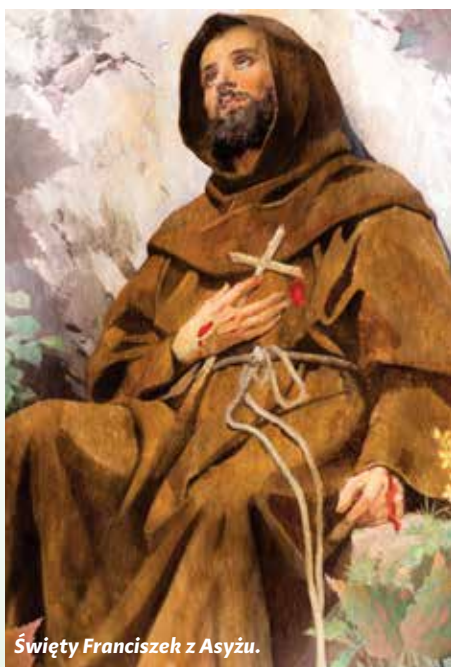
Święty Franciszek z Asyżu.

niej to pragnienie ujawniło się w jego kontemplacji tajemnicy Wcielenia i Męki Pańskiej. Franciszek chciał widzieć ubóstwo narodzonego Chrystusa i słyszeć Jego płacz, aby lepiej pojąć, jak bardzo Bóg unżył się z miłości do człowieka. Z tego głębokiego pragnienia narodziło się wydarzenie w Greccio w 1223 roku. Franciszek poprosił, aby przygotować źłób z sianem, sprowadzić woła i osła, tak by wszyscy mogli niemal dotknąć tajemnicy Bożego Narodzenia. Nie chodziło o widowisko, lecz o to, by sercem przeżyć Ewangelię: zobaczyć Dziecię w ubóstwie i usłyszeć Słowo, które stało się ciałem. Podobne pragnienie towarzyszyło mu w kontemplacji Męki Pańskiej. Franciszek chciał „widzieć” cierpienie Chrystusa i „słyszeć” Jego wołanie z krzyża, aby jeszcze głębiej zjednoczyć się z Nim w miłości. To wewnętrzne dążenie do pełnego współodczuwania doprowadziło go do niezwykle łaski stygmatów na górze La Verna. Jego ciało stało się miejscem, w którym tajemnica krzyża została dosłownie zapisana. Pragnienie „widzenia i słyszenia” miało również wymiar codzienny. Franciszek umiał dostrzegać Boga w stworzeniu – w śpiewie ptaków, szumie wiatru, prostocie ziemi. Cały świat był dla niego jak otwarta księga, w której można „zobaczyć” ślady Stwórcy i „usłyszeć” Jego czułe wezwanie do miłości. Stąd rodziła się jego wrażliwość, radość i wdzięczność wyrażona w „Pieśni słonecznej”. Dla św. Franciszka