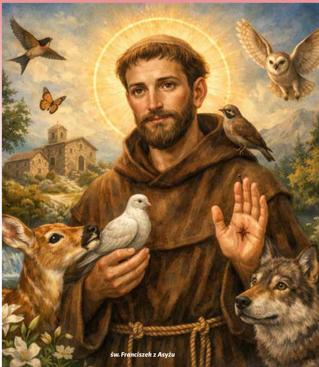
św. Franciszek z Asyżu

Na łamach tego numeru dzielimy się wydarzeniami