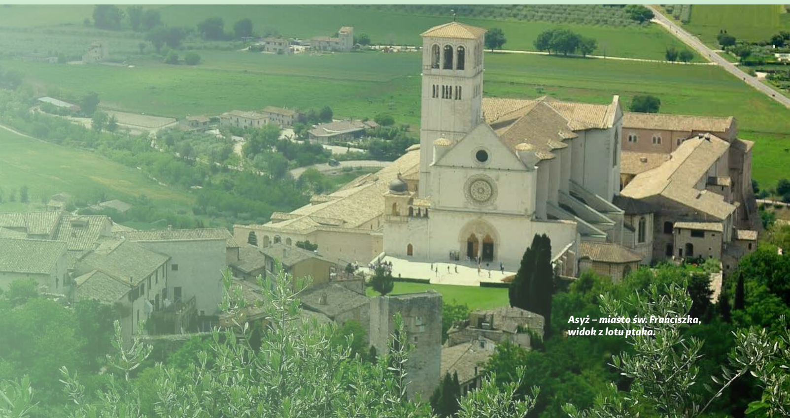
Asyż – miasto św. Franciszka, widok z lotu ptaka.