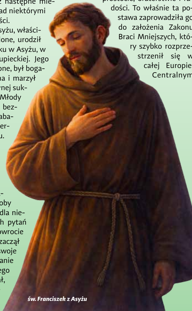
św. Franciszek z Asyżu

prostocie, braterstwie i radości. To właśnie ta postawa zaprowadziła go do założenia Zakonu Braci Mniejszych, który szybko rozprzestrzenił się w całej Europie. Centralnym