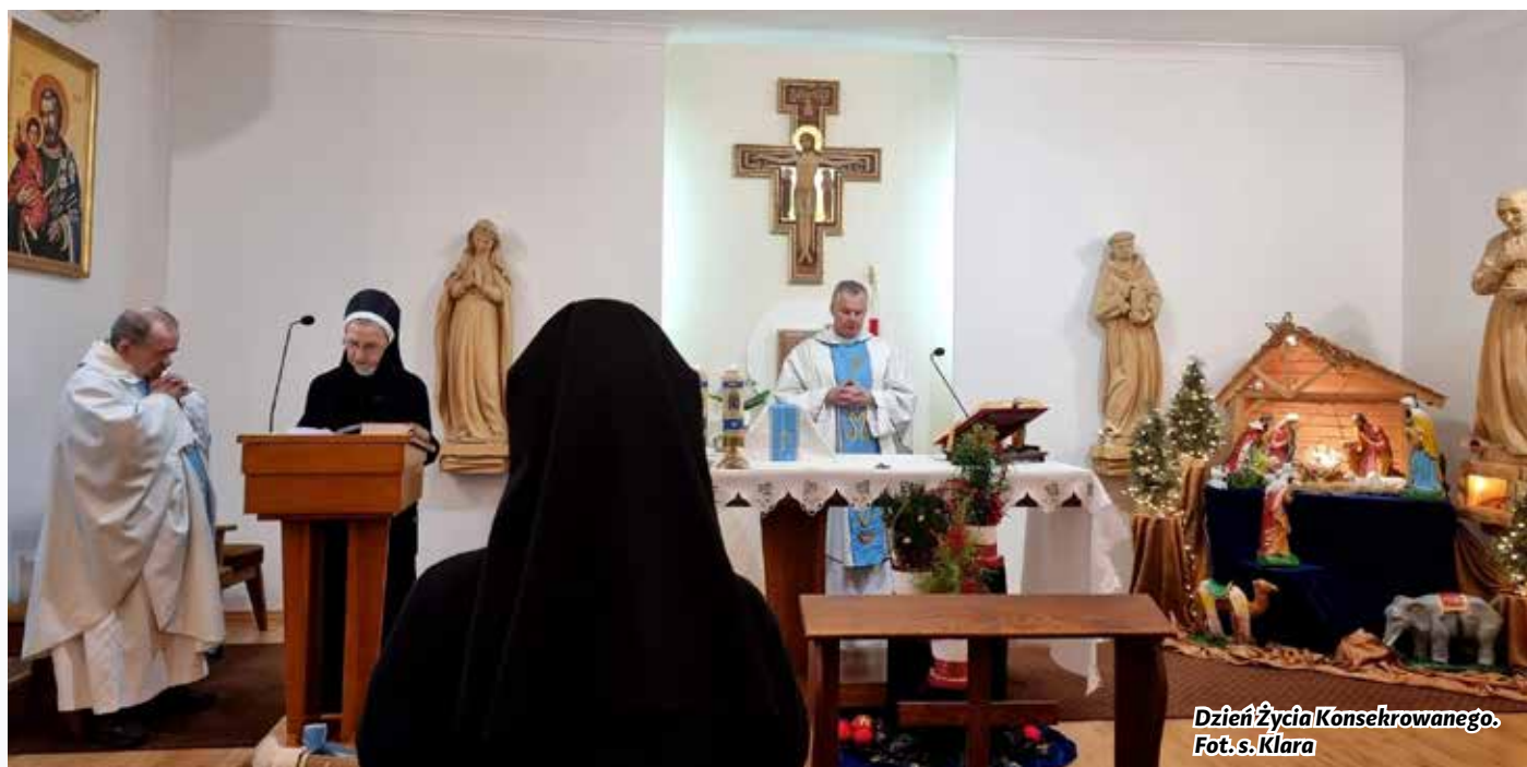
Dzień Życia Ksekrowanego.