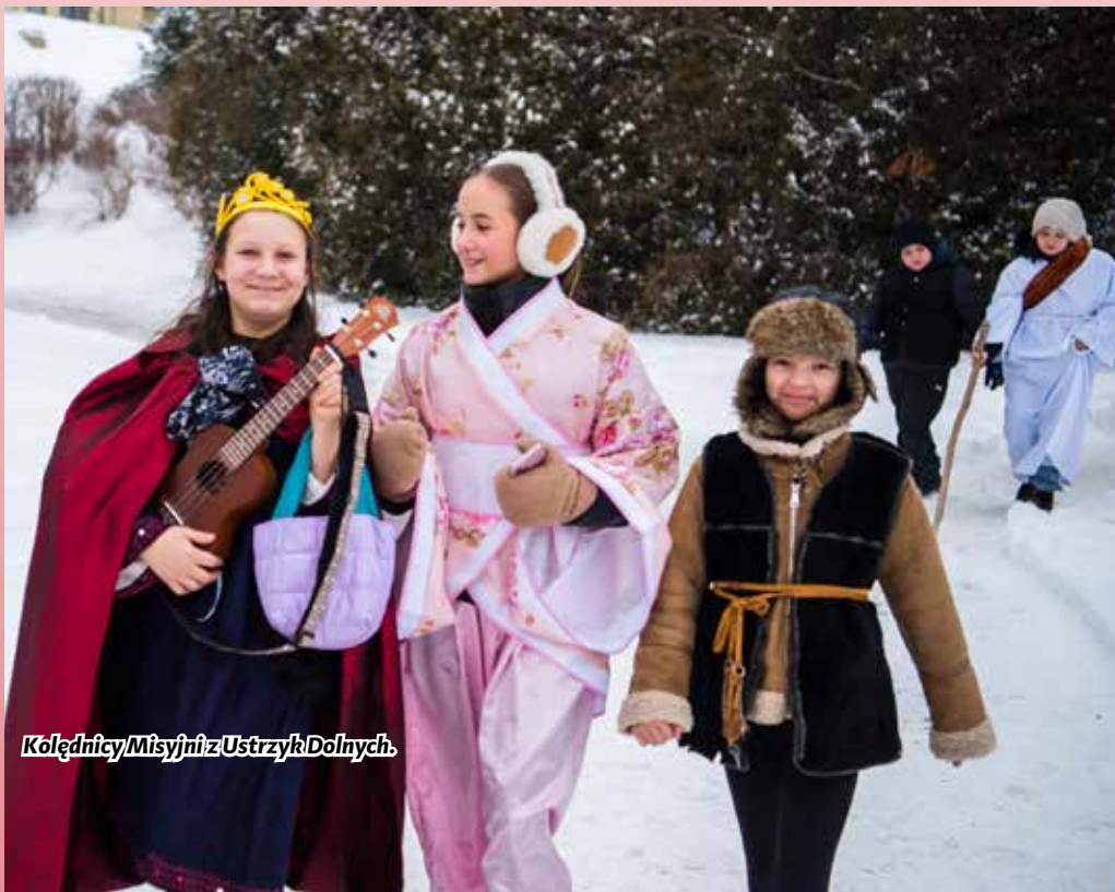
Kolędnicy Misyjni z Ustrzyk Dolnych.