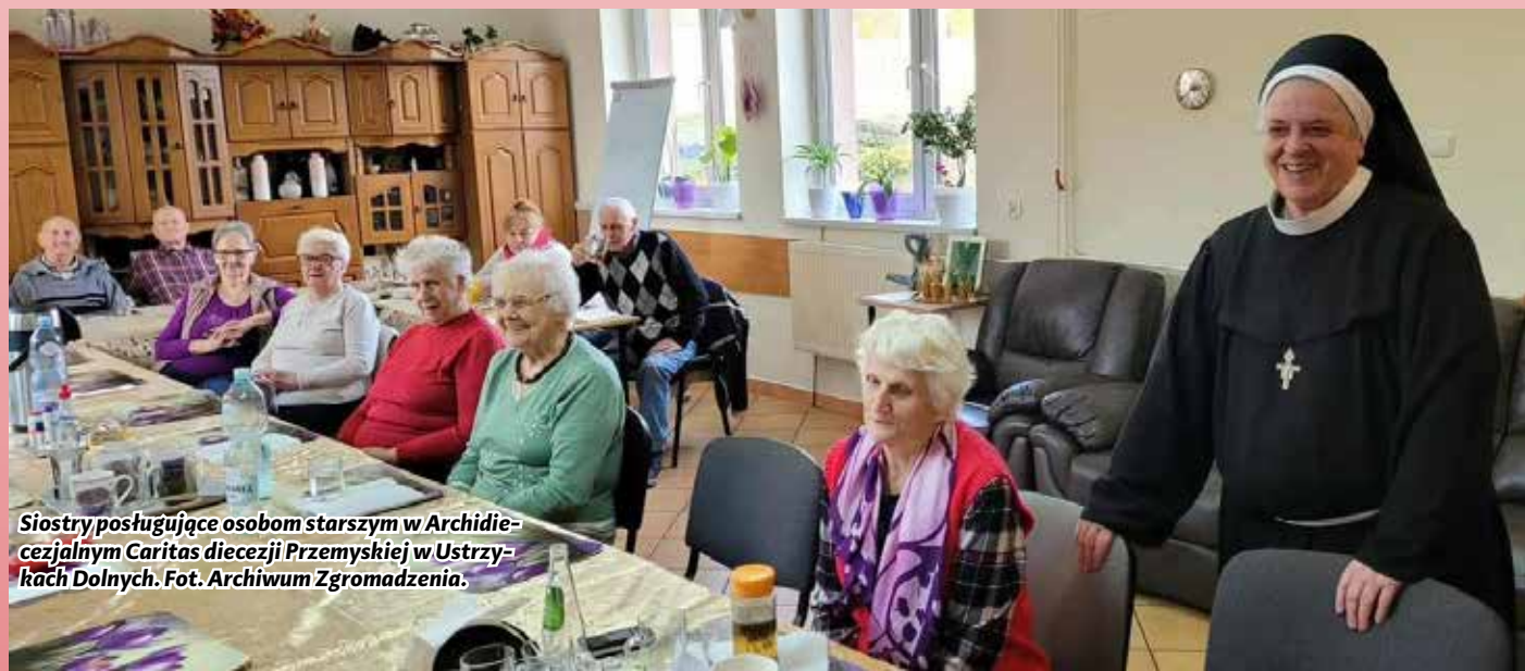
Siostry posługujące osobom starszym w Archidiecezjalnym Caritas diecezji Przemyskiej w Ustrzykach Dolnych.

Ofiary zebrane podczas kolędowania, ze sprzedaży kredy i kadzidła oraz sianka wigilijnego, zostały przeznaczone